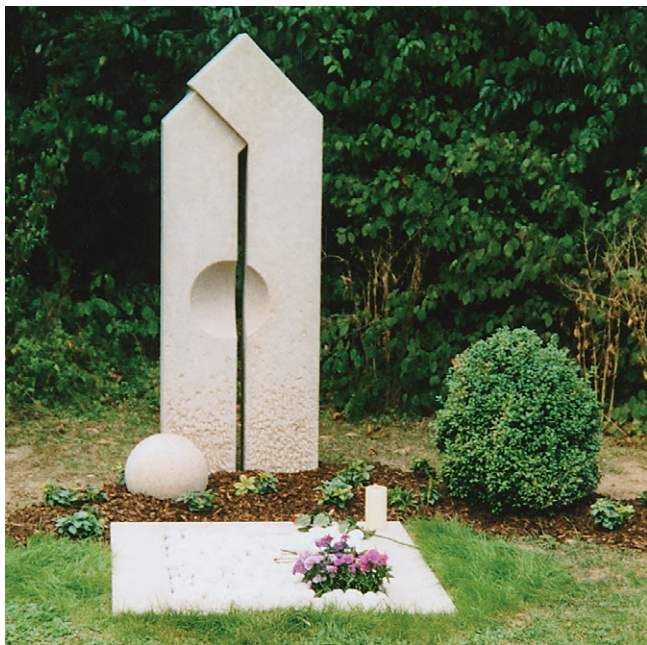
Grab- und Gedenkstätte „Leere Wiege“ auf dem Mühldorfer Nordfriedhof.

Wir möchten Ihnen beim Abschied von dem jungen Leben beistehen und Ihnen in Ihrer Trauer Unterstützung anbieten.